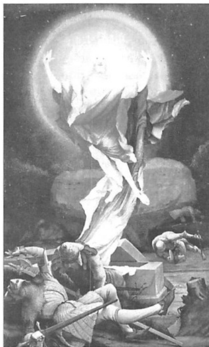
Die Auferstehung, Matthias, Grünewald 1512–1516