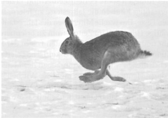
Hase auf der Flucht

stadtkinder schon alle einmal einen Hasen beobachten können. Welcher Mensch wäre nicht entzückt, wenn spielende, männchenmachende Hasen am Waldrand zu beobachten sind! Das gelingt nicht so leicht, denn der Hase hat ein außerordentlich feines Gehör, er ist „ganz Ohr“. Die Augen sind äußerlich nicht scharf, man sagt sogar, er schliefe mit offenen Augen. Unaufhörlich horcht er, was die Umwelt zu sagen hat, witternd und wie ein Sinnbild der Wachsamkeit spiegelt er deren Bewegung. In sie hinein lauscht er mit seinen langen, hochgestellten, vor Aufregung manchmal geradezu zitternden Ohren („hellhörig“).